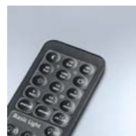
Inkl. RC12 bei Sensor-Variante