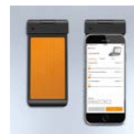
Smart Remote optional